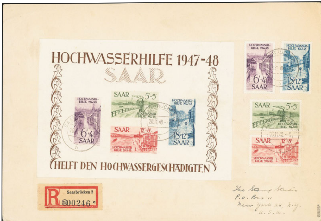
Los 2306 Ausruf: 2.000 €