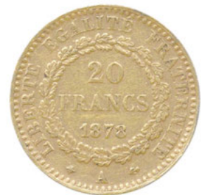
Los 5274 Ausruf: 2.500 €