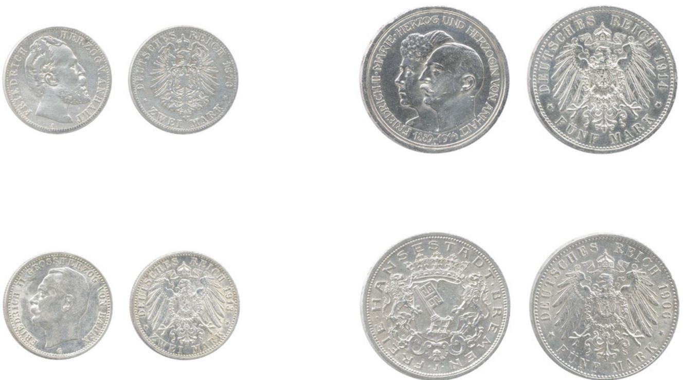
Los 5237 Ausruf: 9.000 €